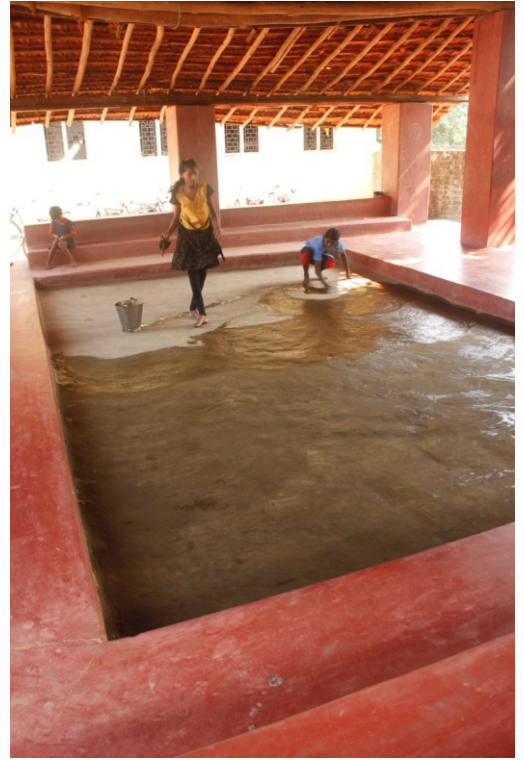
फर्श पर गोबर से साप्ताहिक लिपाई ▶

शुक्रवार सामूहिक गान से शुरू होता है. जो बच्चे गाना चाहते हैं वो इसमें शामिल होते हैं. उसके बाद स्कूल की सफाई, रखरखाव, मरम्मत और सामान की गिनती का वक्त होता है. तब सारी झाड़ूयों, बाल्टियों, टब, मग और पोछे के कपड़ों की गिनती होती है. तब छत से लटके मकड़ी के जालों को साफ किया जाता है, टीचिंग-एड्स और खिलौनों की टूट-फूट ठीक की जाती है और फर्श पर गोबर लीपा जाता है. इस रखरखाव के काम का इनाम 10.30 बजे मिलता है. तब पूरा स्कूल मिलकर चने-मुरमुरे, मौसमी फल, खजूर और मेहमानों द्वारा लाई गयी चीजें खाता है.